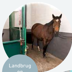
Landbrug og staldudstyr